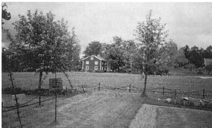
Prästgården i Hagshult belägen intill kyrkan där